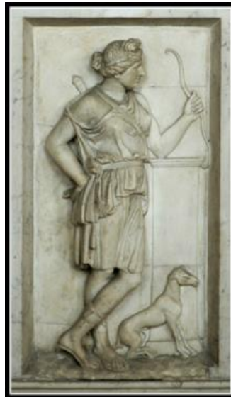
Artemidė ir šuo. Romėnų kopija, I a., pagal IV a. pr. Kr. graikų originalą, Roma, Vatikano muziejai.

Kadangi šunys yra labai interaktyvūs ir gyvenantys šalia mūsų, žmonių, žmonės jaučia didelį norą susisieti ir net dirbti kartu su šunimis. Šunys istoriškai visada buvo žmonių palydovai, o jų ryšį galima atsekti iki priešistorinių laikų [1]. Šunys vaidino įvairius vaidmenis žmonių bendruomenėse – nuo medžioklės ir ganymo iki sargybos ir draugystės – jie buvo būtini žmogaus išlikimo ir pažangos veiksniai. Senovės civilizacijos, tokios kaip egiptiečių, graikų ir romėnų, gerbė ir vertino šunis už jų ištikimybę ir gebėjimus. Istorijos tėkmėje jie evoliucionavo ir tapo socialiniais gyvūnais, nesvarbu, ar tai būtų medžioklė, ar vienas kito saugojimas ir pan. Šis įgimtas jausmas, kartu su jų pagarbiu elgesiu, leidžia jiems lengvai integruotis į žmonių šeimą, nesvarbu, ar tai būtų glaudūs santykiai, dresavimas rengiant apsigyventi namuose ar gerai išauklėti, pasiekti simbiozinius tikslus, pavyzdžiui, judrumą, triufelių ieškojimą ir pan., ar net patenkinti šeiminių poreikių, kurio mums, žmonėms, reikia.