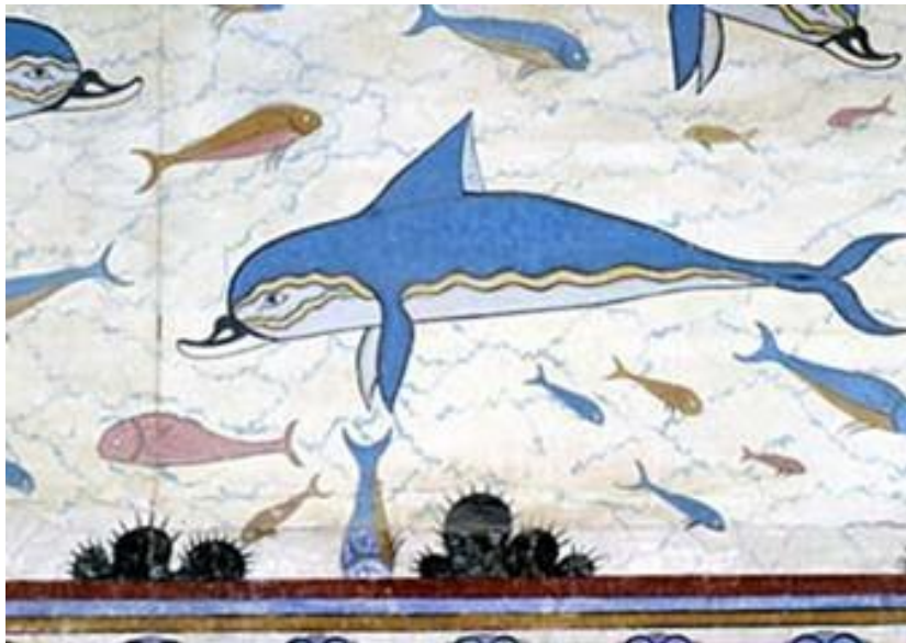
Chriso Johnsonso nuotrauka [19]

Vis dėlto šis susidomėjimas niekuomet neišblėso, nes pastaraisiais metais daugybė delfinarių, teminių parkų, kitų įstaigų kalba apie šiuos nuostabius ir jautrius gyvūnus. Žmonių globoje gyvenantys delfinai yra ne tik džiaugsmas, bet ir didžiulė atsakomybė stiprinti ir skatinti jų natūralų elgesį, nuolatinis darbas su aplinkos gerinimo programomis ir kt. Kalbant apie BUSTA projektą ir demokratinių įgūdžių ugdymą, svarbu žinoti, kodėl delfinai yra tokie unikalūs gyvūnai?